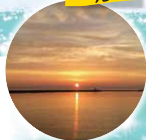
日本海に沈む夕日