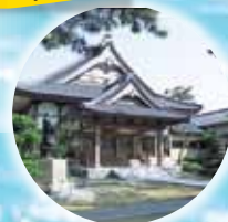
良寛様ゆかりの地 照明寺